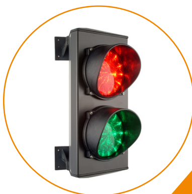
Feux de circulation