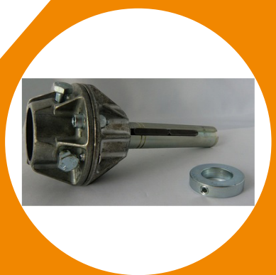
Adaptateur arbre Hörmann