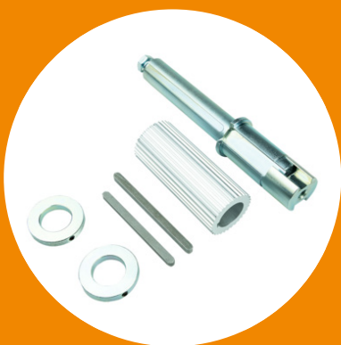
Adaptateur arbre Hörmann, 40mm avec clé