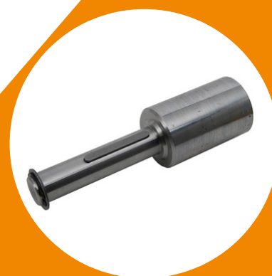
Adaptateur arbre Crawford rond 35 mm