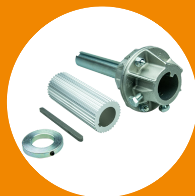
Adaptateur arbre Crawford avec clé