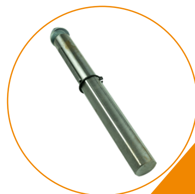
Adaptateur arbre Crawford SW25 /SW27