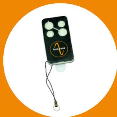
FREQUENZ Émetteur manuel, universel