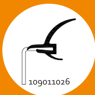
Alpha Deuren, Novoferm, ConDoor