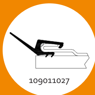
Albin-CE, Alldoorco, Alsta, ConDoor, FlexiForce, Multideur