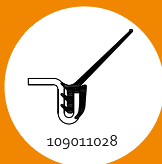
Suitable for Hörmann overhead doors